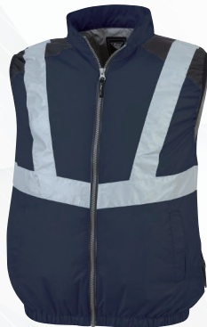
19. ディープネイビー