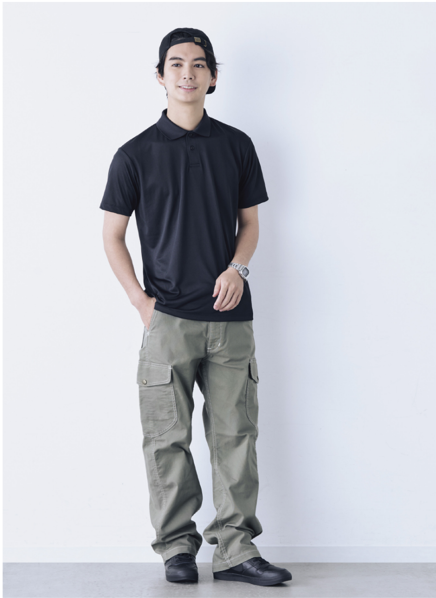
MS3124 (L) 5.6オンスリサイクルポリエステルポロシャツ(ポリジン加工) MC6626 (F) コットンキャップ P87 モデル183cm 他、スタイリストコーディネート