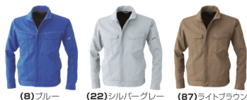
(8)ブルー (22)シルバークレー (87)ライトブラウン