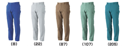
(8)ブルー (22)シルバークレー (87)ライトブラウン (107)モスグリーン (205)ケンブリッジブルー