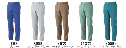
(8)ブルー (22)シルバークレー (87)ライトブラウン (107)モスグリーン (205)ケンブリッジブルー